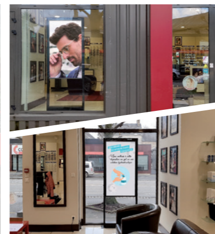
SOLUTION DEUX EN UN Écrans double-face Haute Luminosité côté vitrine et qualité premium côté magasin