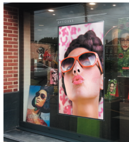
SOLUTIONS VITRINE Écrans Haute Luminosité pour un maximum de visibilité